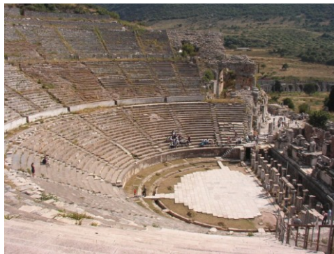
Theater von Ephesus