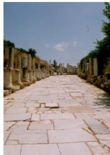
Strasse von Ephesus